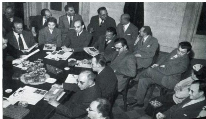
Una riunione di studio dei primi collaboratori del Consultorio.